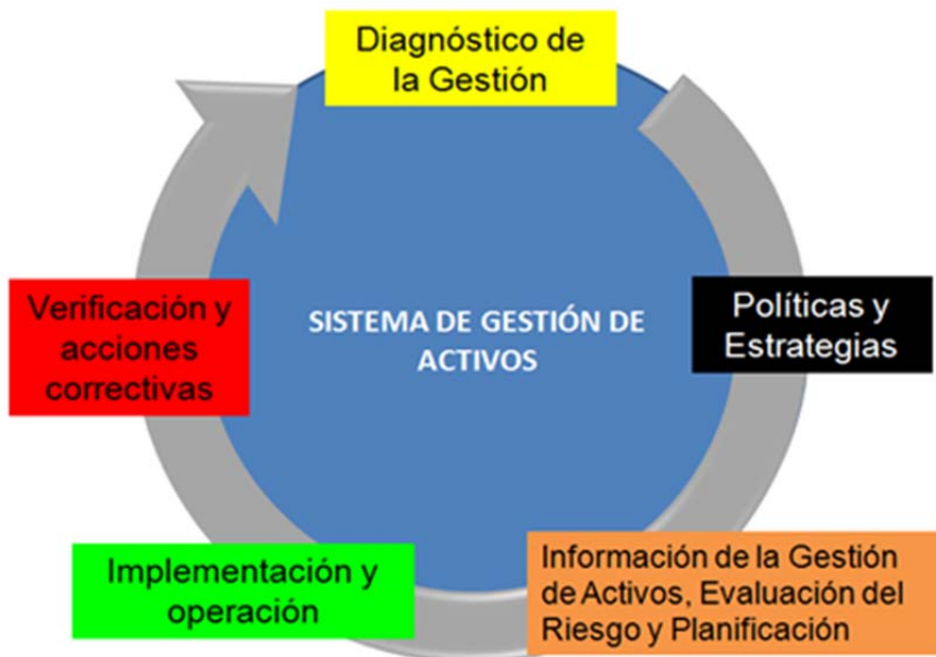
Figura 1. Pilares en la Gestión de Activos

Es importante recordar que los pilares de la gestión de activos tienen que ir siempre de la mano de la innovación y la creación de valor añadido. Recuerdo cuando estaba en la industria del petróleo como gerente en América y luego en la universidad – industria en Europa y cuando creé como máximo directivo, junto a un grupo de grandes profesionales a PMM Institute for Learning, no estábamos creando una óptica más, sino que estábamos aportando un valor añadido a lo que existía en ese momento, «sus gafas en una hora».